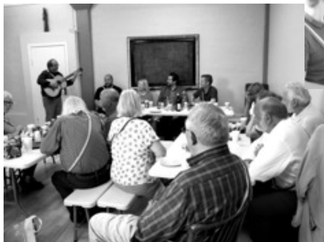
Dirigenten, ex-præsident Søren Thorborg, stod for underhold- ningen efter den formelle seance