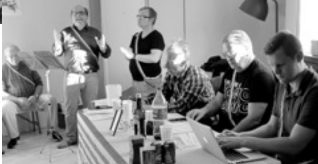
Dirigenten dirigerer Generalforsamlingen - find 3 ex-præsidenter