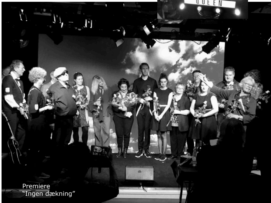
Premiere "Ingen dækning"