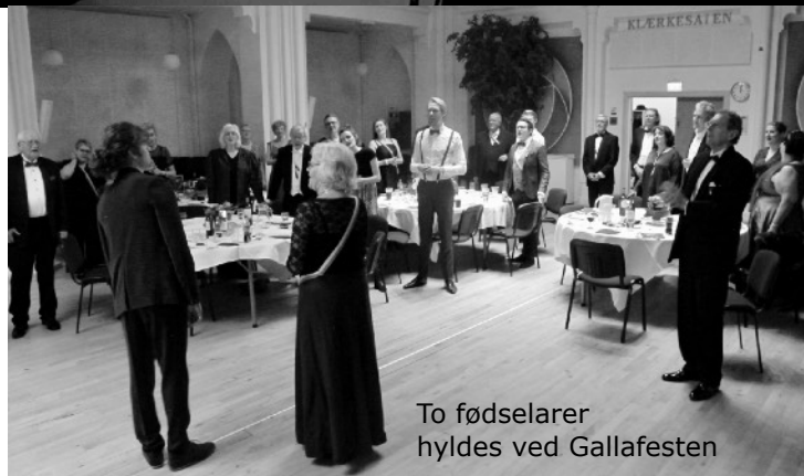
To fødselarer hyldes ved Gallafesten