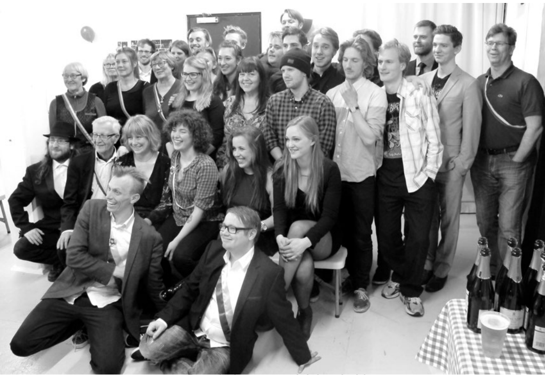
Det glade revyproduktionshold 2016