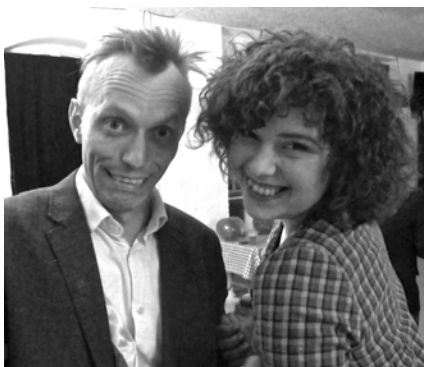
Præsidenten og koreografen konfererer