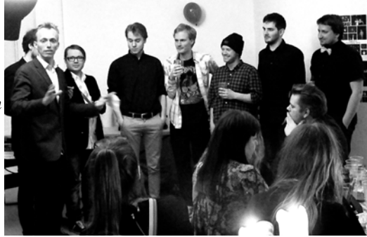
Orkesteret får prisen